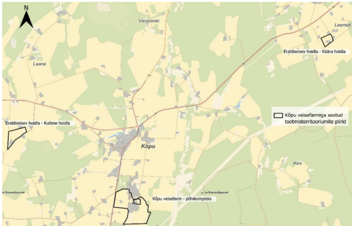
Joonis. Kõpu veisefarmiga seotud tootmisterritooriumite asukohad (aluskaart: Maa- ja Ruumiamet).